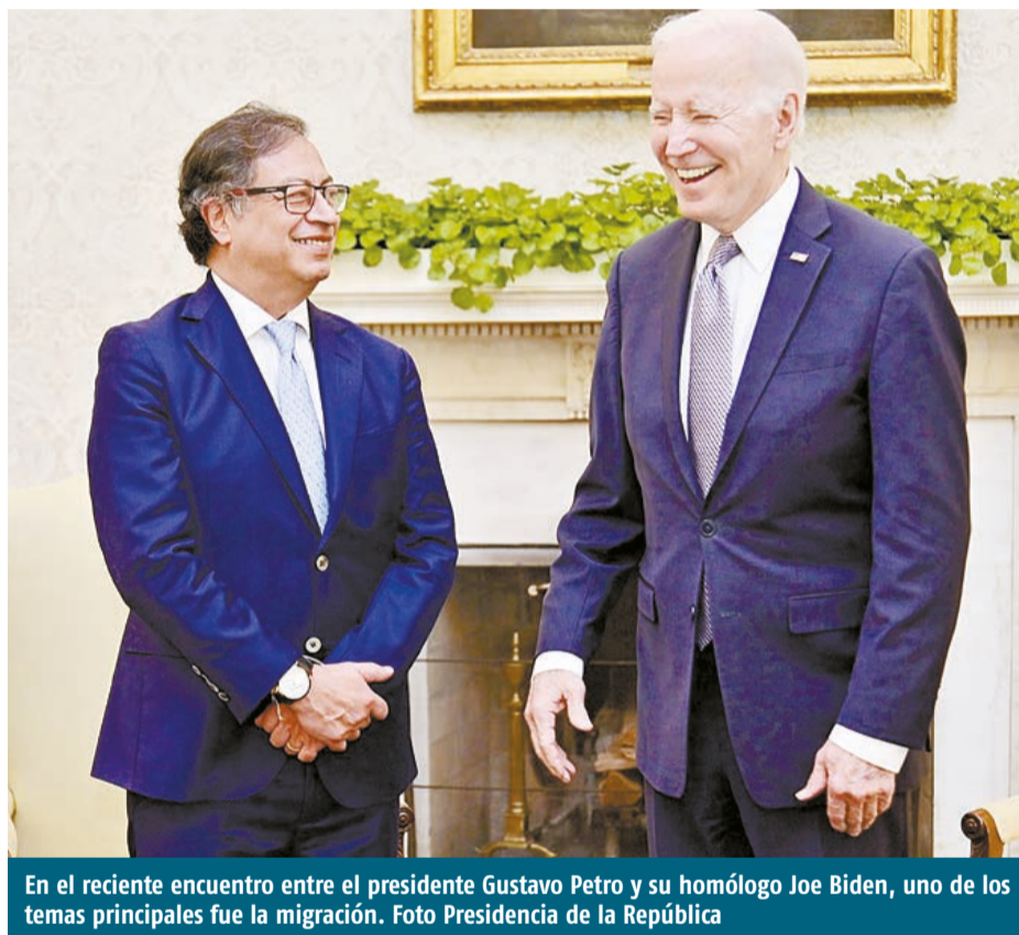
En el reciente encuentro entre el presidente Gustavo Petro y su homólogo Joe Biden, uno de los temas principales fue la migración.

Seguros", es decir, territorios donde los solicitantes de asilo pueden ser devueltos porque en teoría no existe peligro a su seguridad y la posibilidad de solicitar asilo.