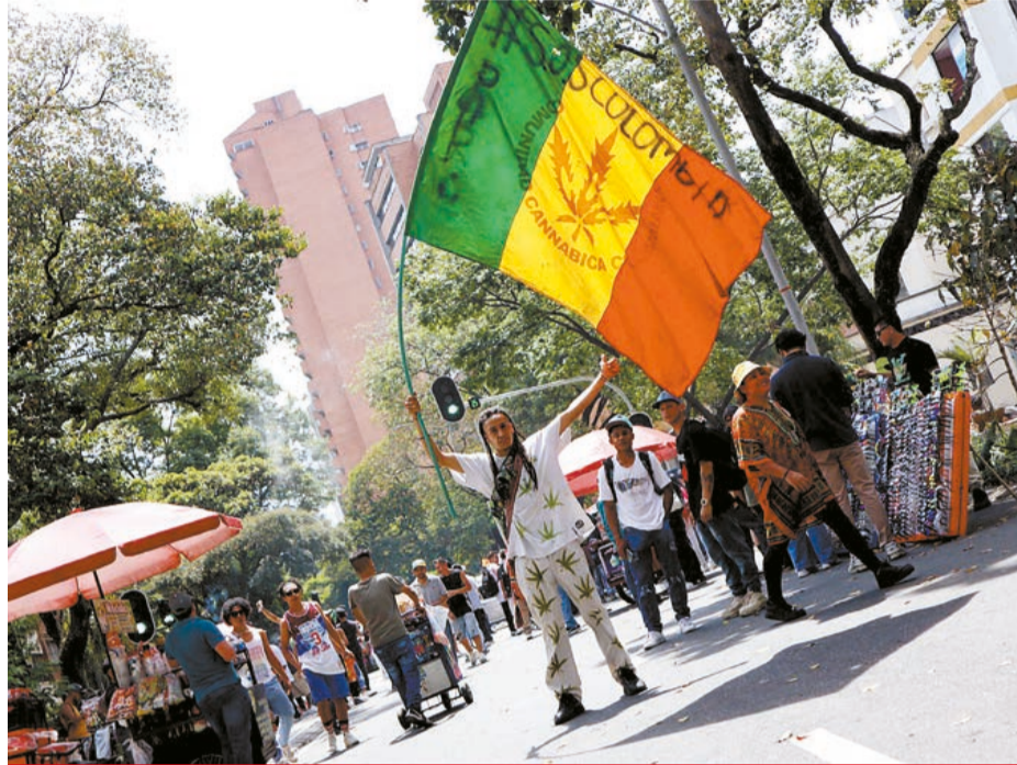
Marcha cannábica en Medellín.

La legalización del cannabis en Colombia abre una nueva era para la sociedad colombiana. El congresista Losada enfatizó que, “hay un país en el mundo que tiene la autoridad moral para replantear la fallida guerra contra las drogas, ese es Colombia. Es hora de regular el cannabis de uso adulto para