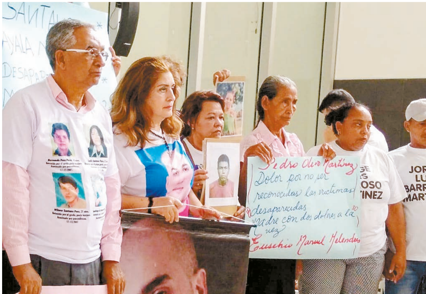
Víctimas han solicitado en varias oportunidades que Salvatore Mancuso sea extraditado a Colombia.

La posibilidad de que Mancuso aporte un caudal probatorio novedoso,