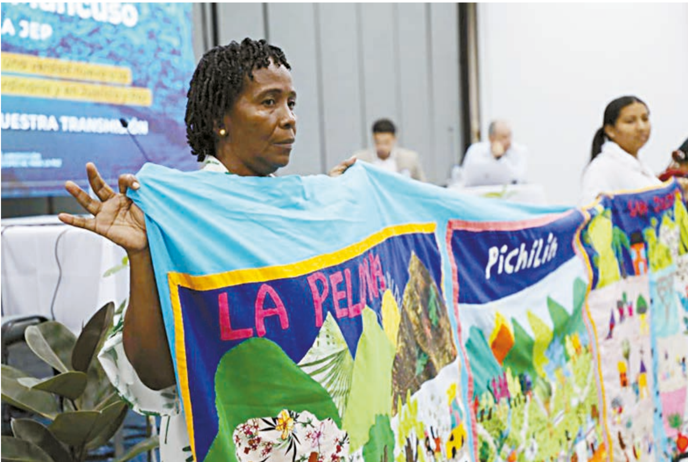
Las víctimas del paramilitarismo participaron de la audiencia con varios actos simbólicos.

Un relato crudo. Hechos nuevos y conocidos aportan nuevas perspectivas a la verdad. Ahora, los determinadores y autores intelectuales deben comparecer ante la JEP