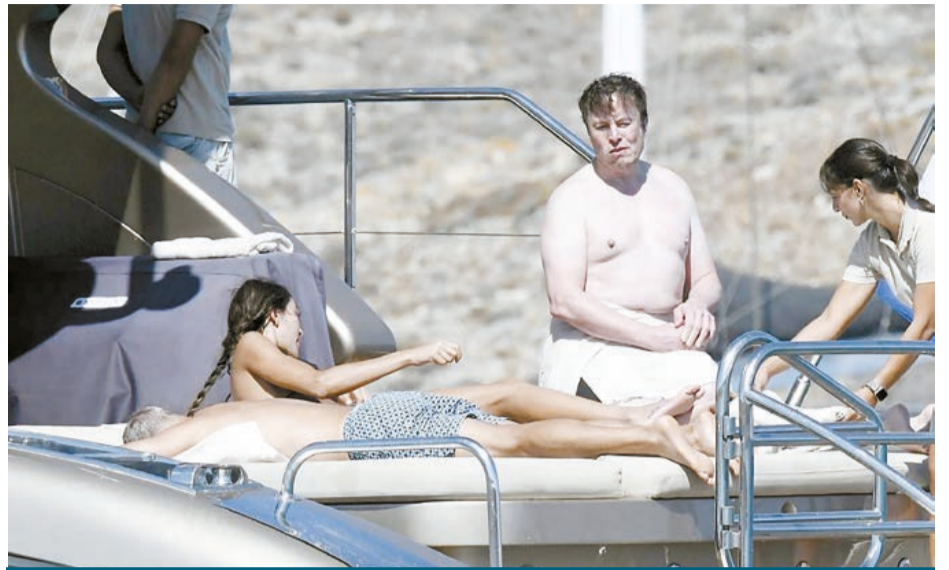
Elon Musk (con una fortuna de 176.9 miles de millones de dólares) a bordo de un yate de lujo en Grecia.

Toda esta carrera por ver quién contamina más, al aparentar estimular el desarrollo científico —o sea, la más