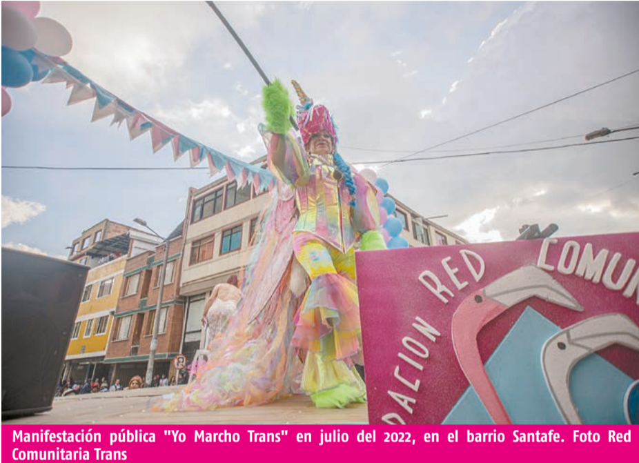
Manifestación pública "Yo Marcho Trans" en julio del 2022, en el barrio Santafe.

Las obras públicas y proyectos de vivienda en el centro de la ciudad ponen en tensión las dinámicas de hábitat frente a los intereses privados y estatales de construcción e inversión