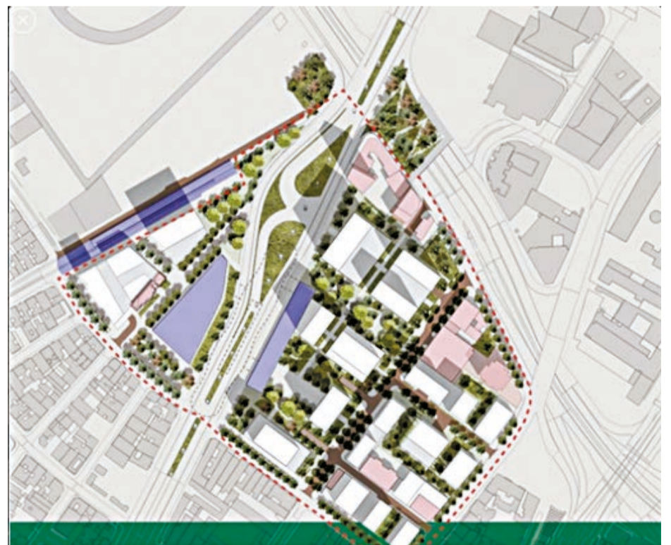
PLAN PARCIAL DE RENOVACIÓN URBANA "ESTACIÓN METRO CALLE 26"

Esta es una invitación al reclamo de ese derecho y a la pertinencia de las opciones que nos propone el colectivismo, las nuevas expresiones de la familia y la disidencia sexual y de género frente a planes de renovación urbana que, en nombre del mercado, desconocen la dignidad y el derecho a habitar de las personas más vulnerables de la sociedad. ★