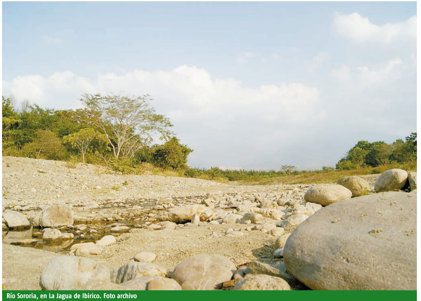
Río Sororia, en La Jagua de Ibirico.

riaciones interanuales (mensuales) de lluvia se deben fundamentalmente al paso por nuestro territorio de la denominada Zona de Convergencia Intertropical, Zcit, dejando dos períodos de lluvia y dos de ausencia de esta.