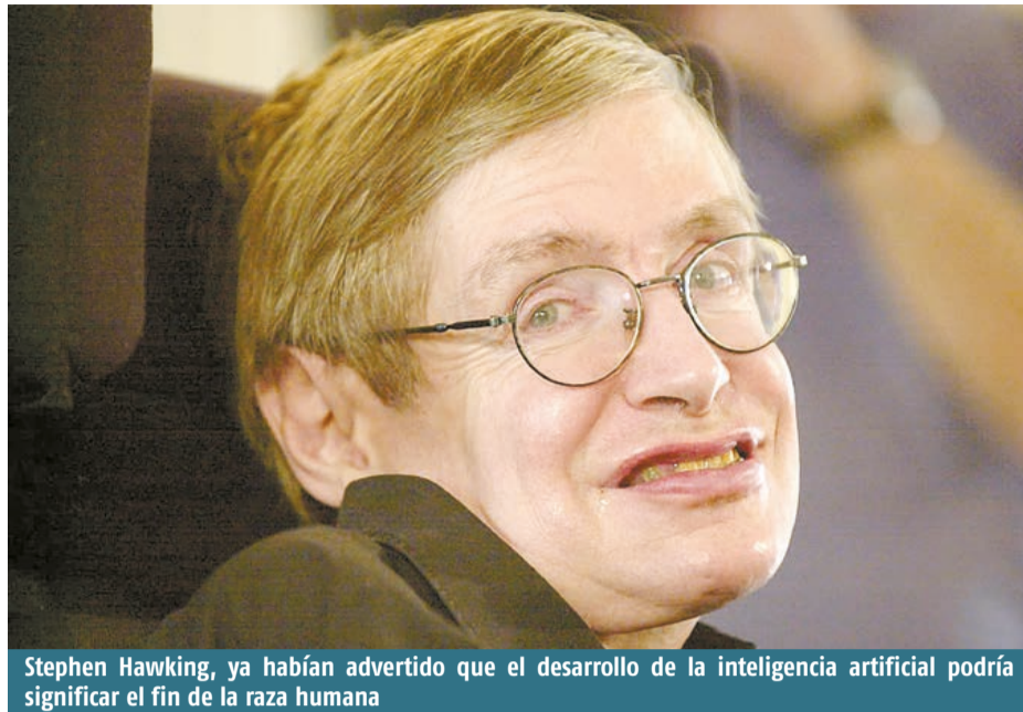
Stephen Hawking, ya habían advertido que el desarrollo de la inteligencia artificial podría significar el fin de la raza humana

Los diseñadores de IA deberían insertar estratégicamente intervenciones