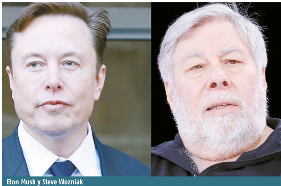
Elon Musk y Steve Wozniak