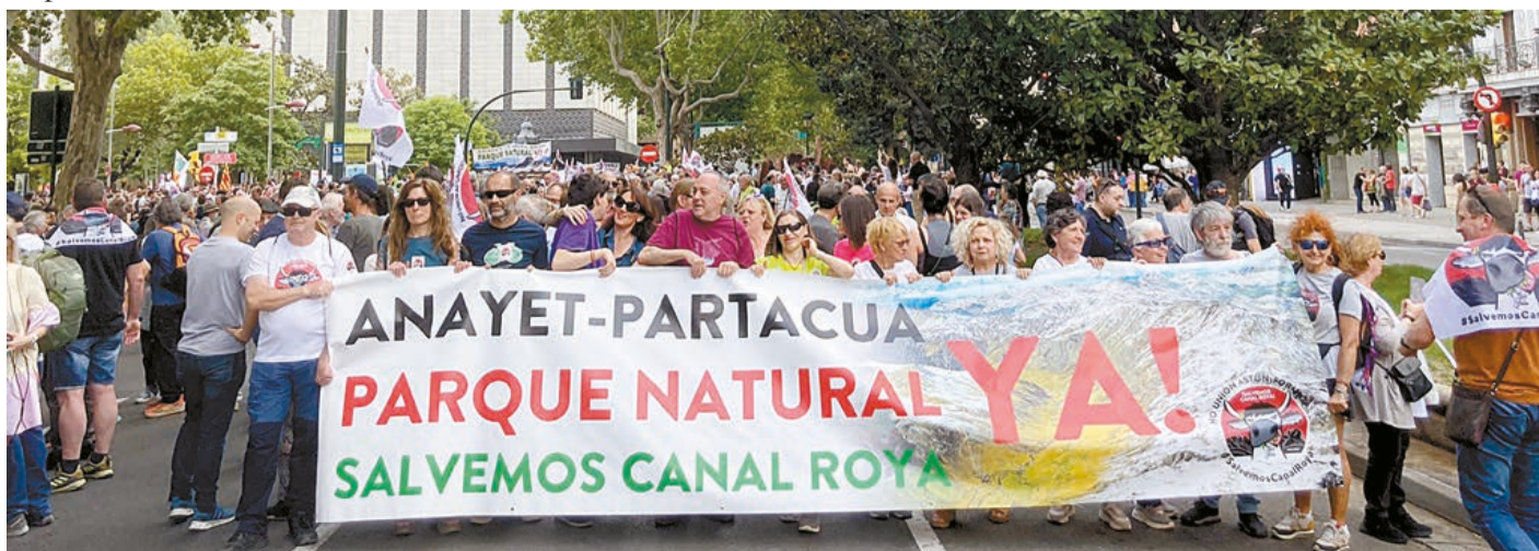
Protesta en Aragón para proteger el parque natural de Anayet. Se manifiestan “en contra de la explotación de su tierra para el beneficio económico de unos pocos”.

Las asociaciones de ecologistas ahora están exigiendo que los dineros que iban a ser dilapidados en el proyecto derrotado deben utilizarse en la construcción de un Parque Natural ya, según informa el periódico comunista Mundo Obrero. ★