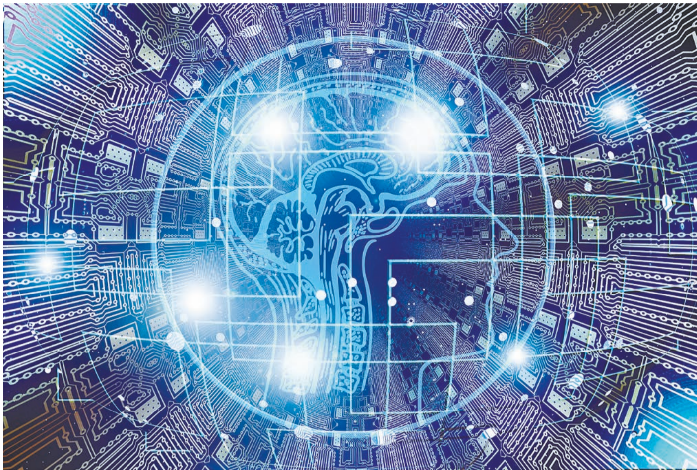
Inteligencia Artificial, imagen ilustrativa.

La IA no solo puede manipular el empleo, también incidiría en el aumento de la desigualdad, podría manipular un proceso electoral, incitar a gobernantes a cometer un genocidio. No obstante, puede regularse, controlarse. ¡Estamos a tiempo!