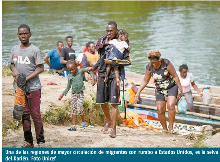
Una de las regiones de mayor circulación de migrantes con rumbo a Estados Unidos, es la selva del Darién.

Esta disposición legal permite al gobierno estadounidense realizar expulsiones en caliente de personas que ingresan al territorio sin visa o documentación por entradas irregulares, dichos destierros acelerados se ejecutan sin debido proceso a "Terceros Países