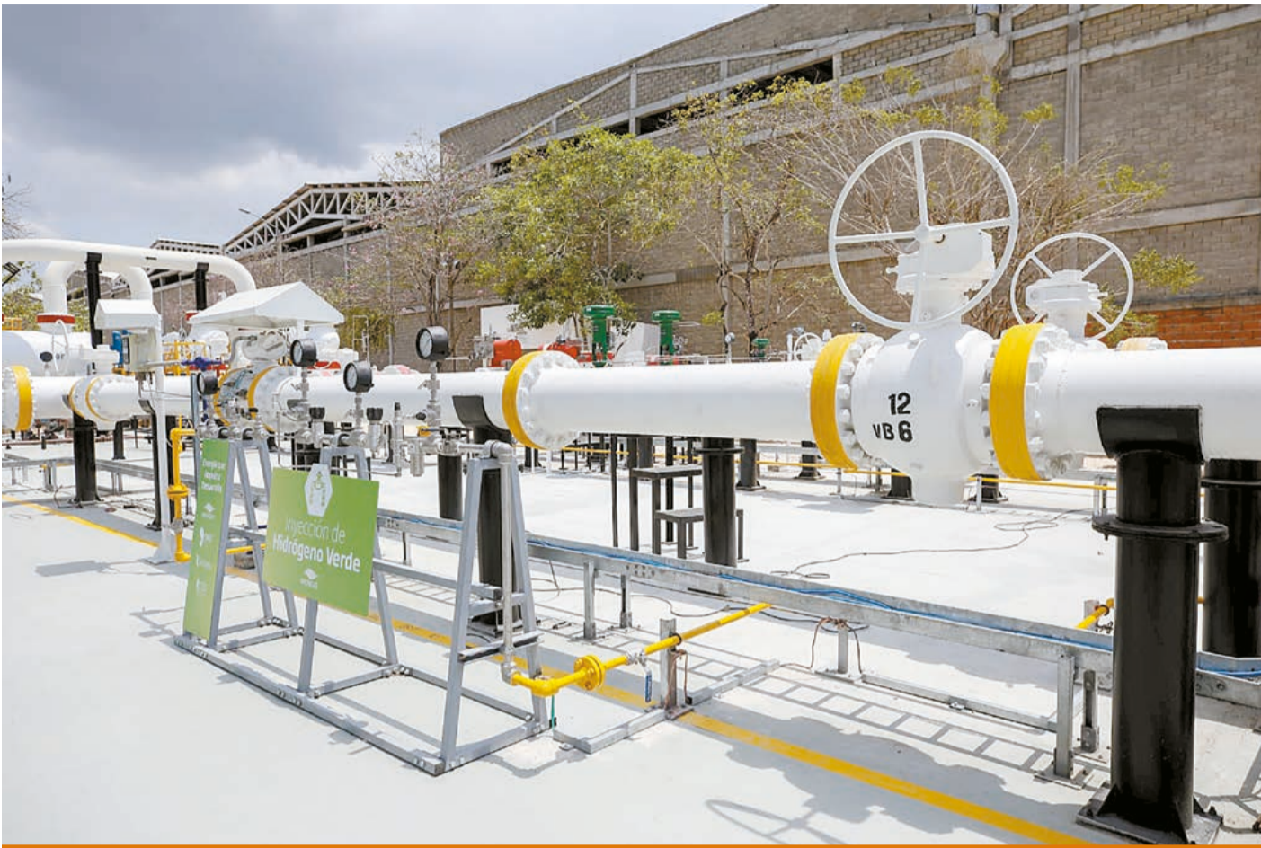
Primer piloto de Hidrogeno Verde en la Refinería de Cartagena.