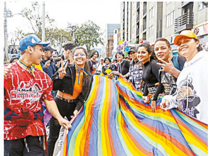
Marcha Diversa del Sur de 2022 en Bogotá.

arbitraria, y de momento incompleta, examinaremos los retos en el acceso a la salud y a la justicia.