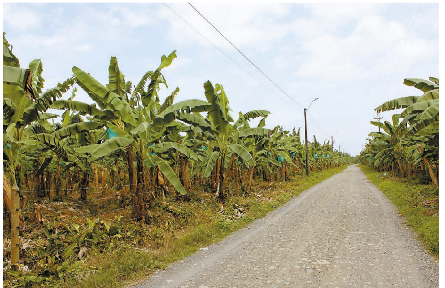
Las vastas extensiones de tierra cultivadas en esta fruta, hacen que sea motor del desarrollo económico de esta subregión.

se definirán temas de interés para los trabajadores, que les permitirá mejorar sus condiciones. Pero los sindicatos tienen claro que el éxito solo depende de su coherencia con los intereses de los trabajadores, de su unidad y capacidad de negociación y movilización, para que esas altas utilidades de las exportaciones también redunden en mejoras en su calidad de vida. ★