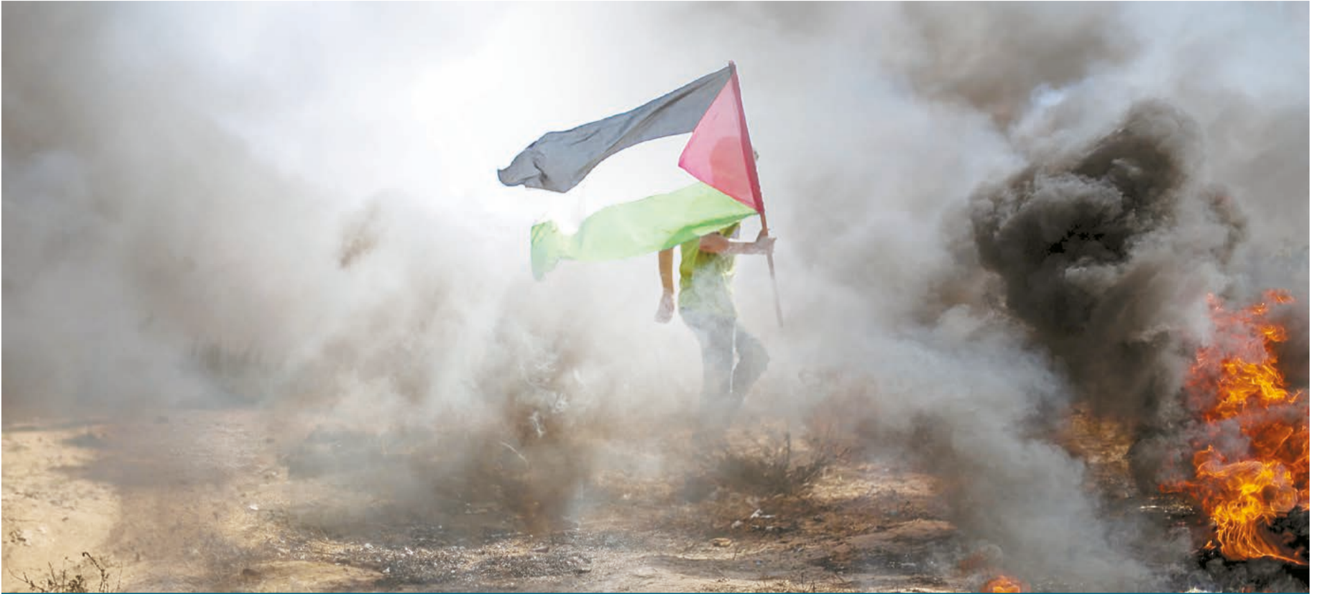
Resistencia palestina en Franja de Gaza.

La más reciente agresión sionista contra la franja de Gaza hace parte del recurso de las acciones del antiterrorismo para gestionar crisis internas