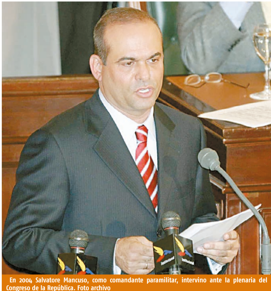
En 2004, Salvatore Mancuso, como comandante paramilitar, intervino ante la plenaria del Congreso de la República.

Con las declaraciones del jefe paramilitar se activan nuevos procesos que involucran a la Fiscalía y al sector privado