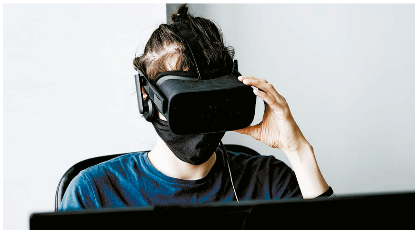
La Inteligencia Artificial se define como sistemas informáticos cuyo propósito es la creación de máquinas que imitan la inteligencia humana.