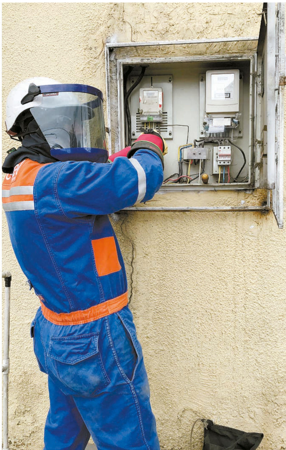
Con los contratos sindicales las empresas que usufructúan la fuerza de trabajo no tienen responsabilidades con el trabajador, esta recae en el sindicato.