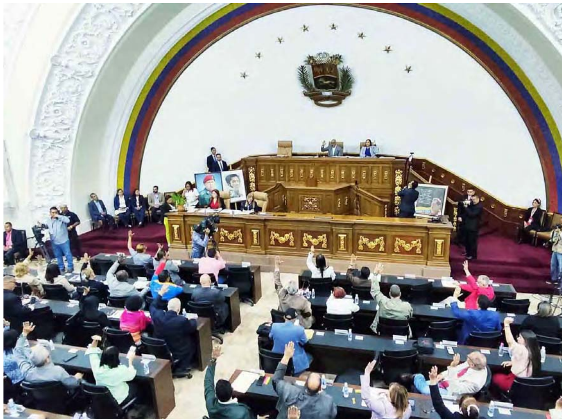
El objetivo es proteger los activos pertenecen al pueblo de Venezuela, destacó Rodríguez

El objetivo de la ley, explicó Rodríguez, es “proteger los activos de la República que le pertenecen a todo el pueblo de Venezuela, para proteger nuestras propiedades en el exterior,