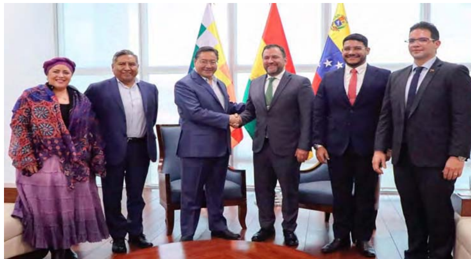
El canciller Gil se reunió con el presidente de Bolivia Luis Arce en la Casa Grande del Pueblo

“Gracias presidente de Bolivia, en el nombre del Presidente Nicolás Maduro traemos un saludo al pueblo boliviano, al cual nos unen lazos históricos de hermandad. Reiteramos la firme decisión de construir una agenda conjunta que consolide el proyecto bolivariano de