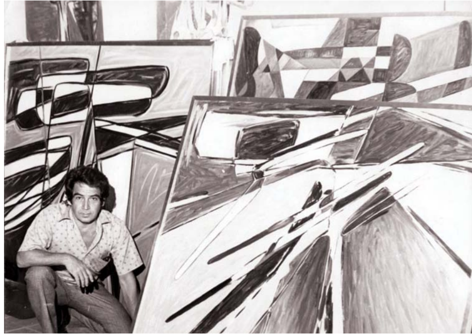
La obra de este valenciano trasciende el tiempo

Y en Boca Ratón Museum of Art, Estados Unidos, ya se presenta una muestra