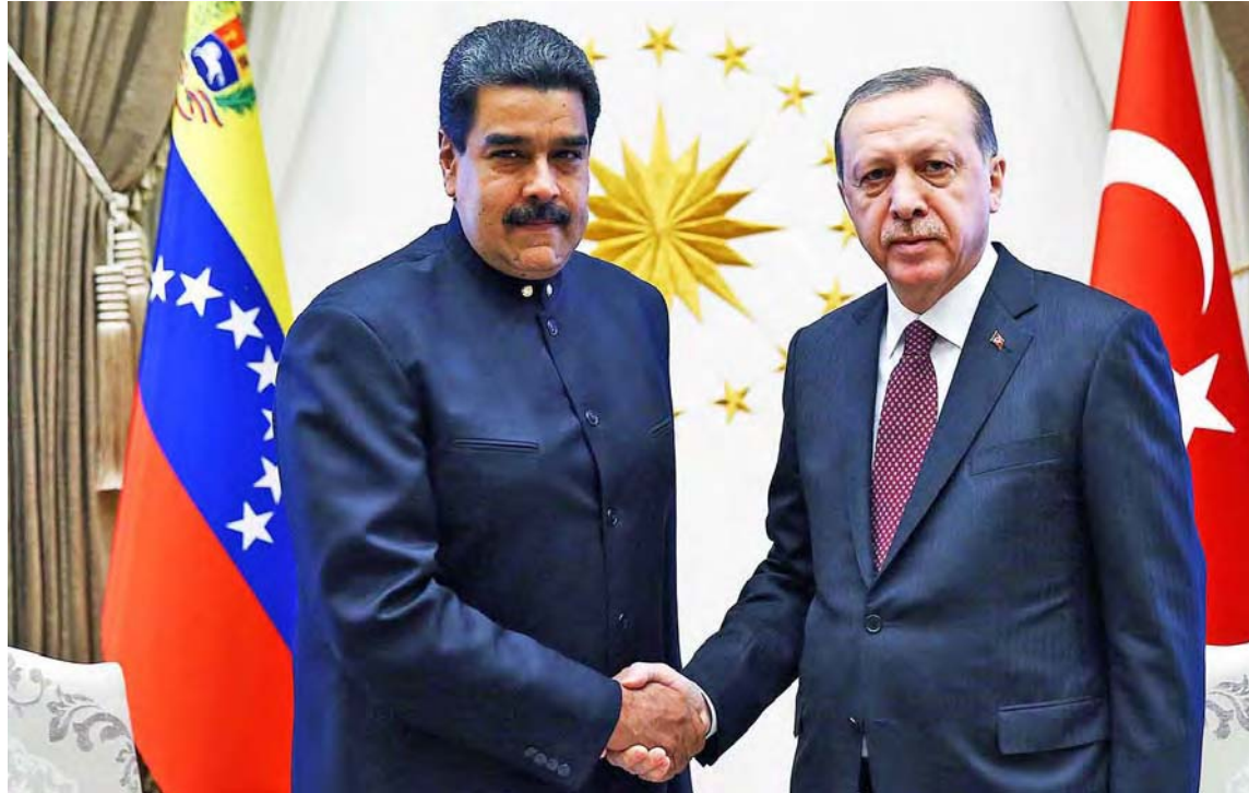
Nicolás Maduro y Recep Erdoğan coincidieron en la necesidad de lograr una alianza estratégica bilateral

Durante un contacto telefónico que sostuvieron ambos Jefes de Estado, el mandatario turco agradeció el espíritu fraternal del Gobierno y del pueblo venezolano, demostrado con el envío de la Fuerza de Tarea Humanitaria Simón Bolívar que se sumaron a las labores de búsqueda en la ciudad de Asiyaman