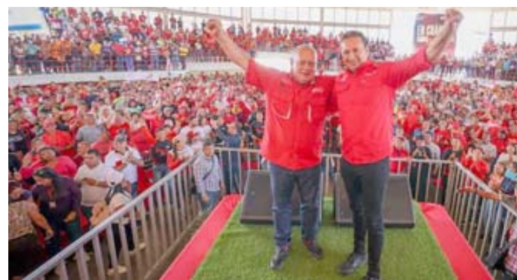
En la Revolución no hay espacios para las diferencias, aseguró Cabello

Recordó que el Padre de la Patria, Simón Bolívar, hablaba de la igualdad establecida y practicada, “establecida en las leyes y practicada por los hombres, las mujeres, los ciudadanos”.