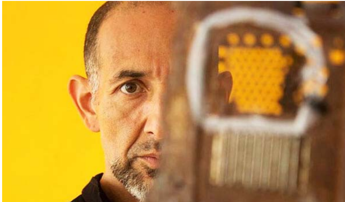
La muestra está suscrita al programa Artista del Mes, en su edición de febrero

Según se desprende de una nota de prensa publicada en el portal del Ministerio para la Cultura, la propuesta permite recorrer momentos clave en la trayectoria creativa de López García, marcada por una línea