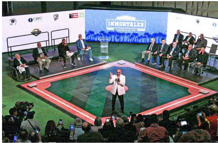
Oscar D'León aprovechó para cantarle a los presentes