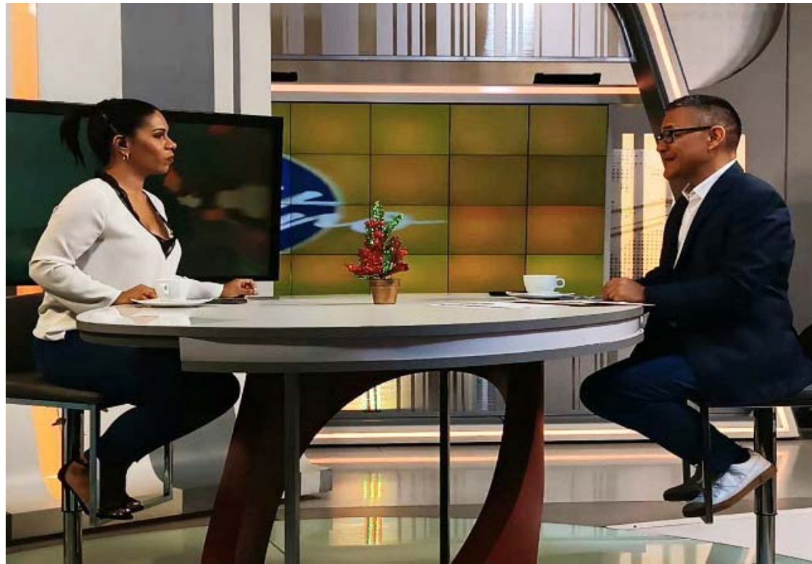
El también periodista está muy optimista para los venideros 365 días

Durante una entrevista con el programa Punto de Encuentro, que transmite Venezolana de Televisión , expresó que “cada paso adelante es una conquista heroica a un pueblo que pretendieron asfixiar. El pueblo venezolano en medio de rigores y dificultades, que en el campo de la cultura no está exento, podemos decir