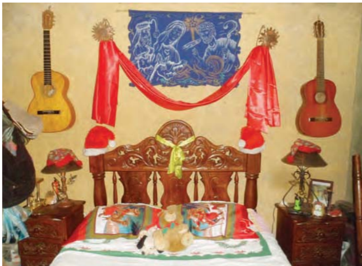
El cuarto dormitorio