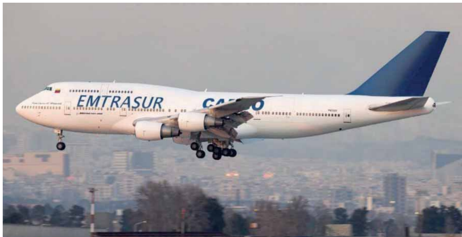
La aeronave tiene entre sus funciones el traslado de medicamento para enfermos crónicos en Venezuela

Si la “justicia” argentina hace lugar a tamaño abuso se propinaría un golpe si no mortal al menos gravísimo a nuestro régimen democrático toda vez que ya no tendría sentido malgastar tiempo y dineros del Estado en elegir diputados y senadores para que elaboren leyes puesto que bastaría con aplicar las que produce el Congreso de Estados Unidos