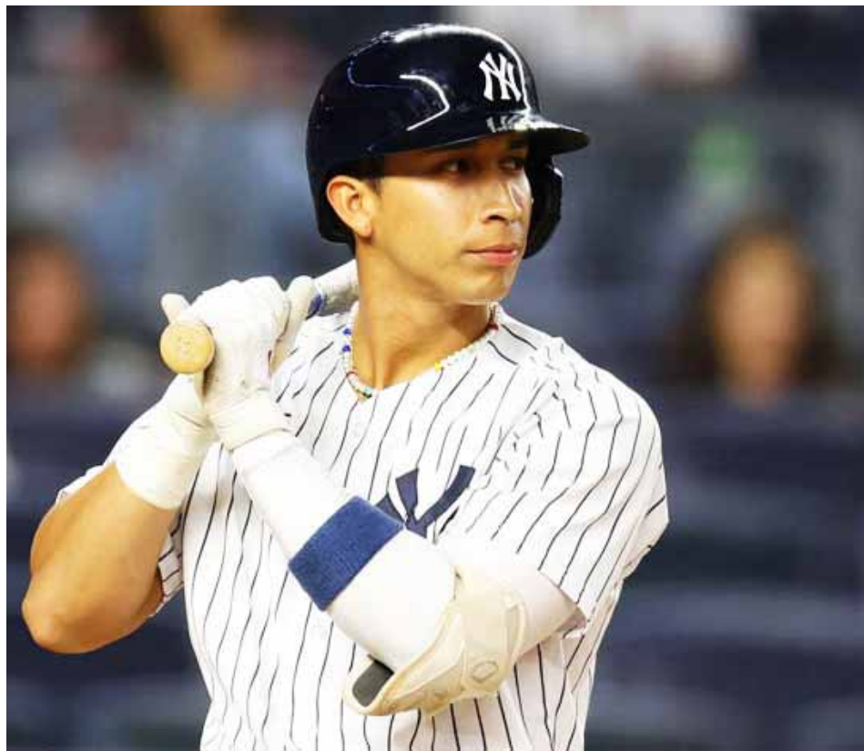
Cabrera tiene buenas cualidades al bate

Es el compatriota número 18 bautizado en las mayores en 2022