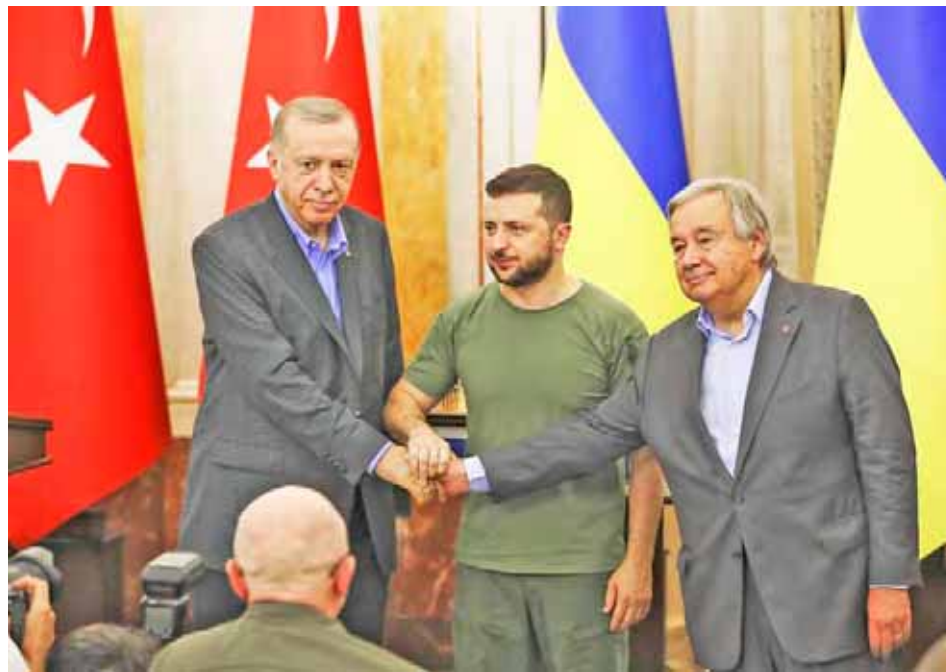
António Guterres se reunió con los presidentes de Turquía, Recep Erdogan y de Ucrania Volodimir Zelenski

Sobre el traslado de cereales, Guterres celebró que luego de la salida de los pri-