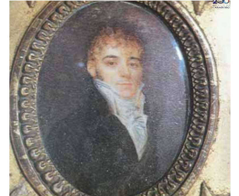
El joven Simón

“Estos ejemplos de errores e infortunios no serán enteramente inútiles para los pueblos de la América meridional, que aspiran a la libertad e independencia. La Nueva Granada ha visto sucumbir a Venezuela; por consiguiente, debe evitar los escollos que han destrozado a aquella. A este efecto presento como una medida indispensable para la seguridad de la Nueva Granada la reconquista de Caracas. A primera vista parecerá este proyecto inconducente, costoso y quizá impracticable; pero examinando atentamente con ojos previsivos, y una meditación profunda, es imposible desconocer su necesidad como dejar de ponerlo en ejecución, probada la utilidad (...). Aplicando el ejemplo de Venezuela a la Nueva Granada y formando una proporción, hallaremos que Coro es a Caracas como Caracas es a la América entera; consiguientemente el peligro que amenaza a este país está en razón de la anterior progresión, porque poseyendo la España el territorio de Venezuela, podrá con facilidad sacarle hombres y municiones de boca y guerra, para que bajo la dirección de jefes experimentados contra los grandes maestros de la guerra, los franceses, penetren desde las Provincias de Barinas y Maracaibo hasta los últimos confines