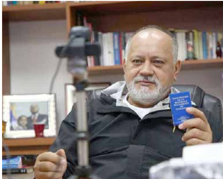
“La militancia del Psuv debe estar al servicio del pueblo”

El primer vicepresidente del Partido Socialista Unido de Venezuela (PSUV), Diosdado Cabello, giró instrucciones a los militantes y dirigentes revolucionarios, dirigidas a mantener la movilización política permanente con