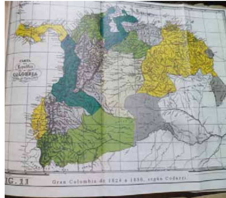
Mapa de Colombia, la bolivariana

“Yo soy, granadinos, un hijo de la infeliz Caracas, escapado prodigiosamente de en medio de sus ruinas físicas y políticas, que siempre fiel al sistema liberal y justo que proclamó mi patria, he venido a seguir los estandartes de la independencia, que tan gloriosamente tremolan en estos Estados. Permitidme que animado de un celo patriótico me atreva a dirigirme a vosotros, para indicaros ligeramente las causas que condujeron a Venezuela a su destrucción, lisonjeándome que las terribles y ejemplares lecciones que ha dado aquella extinguida República, persuadan a la América a mejorar su conducta, corrigiendo los vicios de unidad, solidez y energía que se notan en sus gobiernos.” Acá, por ejemplo, aparece ya la constante en