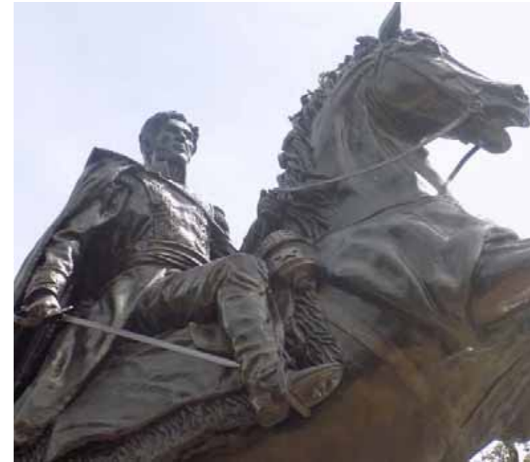
Estatua de Bolívar en Tinaquillo, estado Cojedes

de la América meridional. La España tiene en el día gran número de oficiales generales, ambiciosos y audaces, acostumbrados a los peligros y a las privaciones, que anhelan por venir aquí, a buscar un imperio que reemplace el que acaban de perder. Es muy probable que, al expirar la Península, haya una prodigiosa emigración de hombres de toda clase, y particularmente de cardenales, arzobispos, obispos, canónigos y clérigos revolucionarios, capaces de subvertir, no sólo nuestros tiernos y lánguidos estados, sino de envolver el Nuevo Mundo entero en una espantosa anarquía. La influencia religiosa, el imperio de la dominación civil y militar, y cuantos prestigios pueden obrar sobre el espíritu humano, serán otros tantos instrumentos de que se valdrán para someter estas regiones (...). Así, pues, no queda otro recurso para precavernos de estas calamidades, que el de pacificar rápidamente nuestras provincias sublevadas, para llevar después nuestras armas