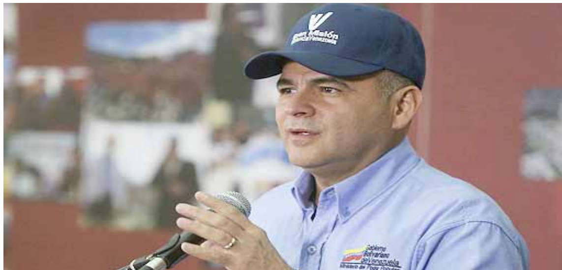
La reforma busca apuntalar la integridad territorial, afirmó Quevedo