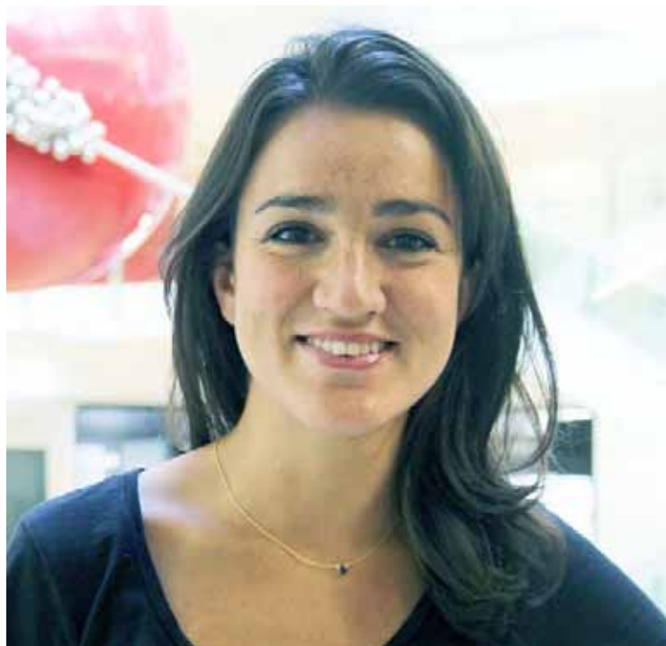
La especialista presta su apoyo vía Internet por la pandemia

“Finalmente, presenté mi aplicación durante la pandemia, sentí que era una oportunidad increíble para probar y experimentar cómo hacer esto de manera significativa y remota, y de colaborar estrechamente con un grupo de arquitectos