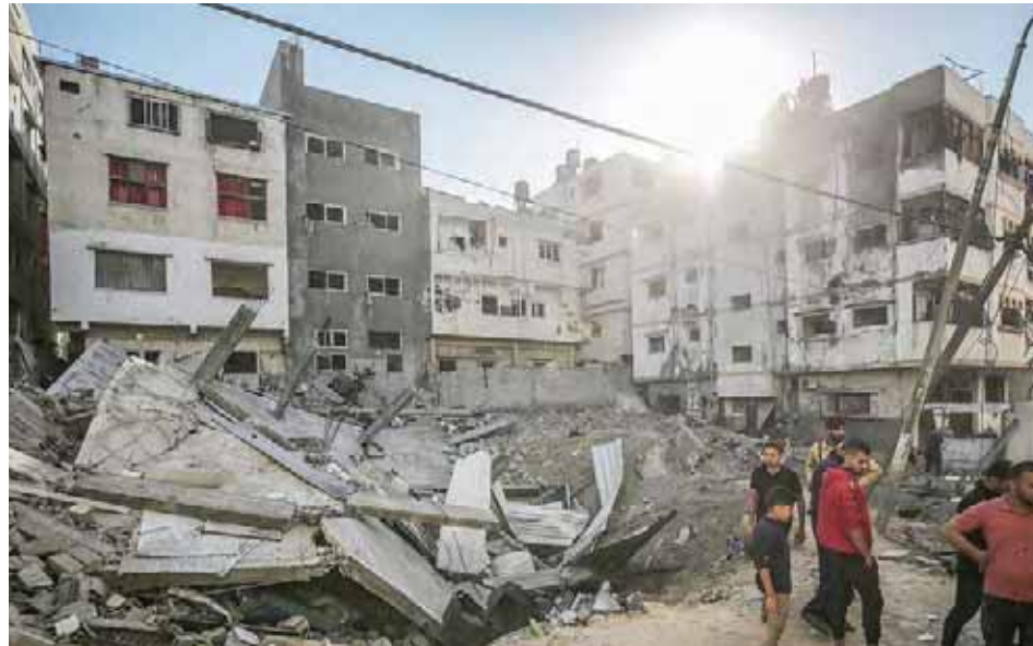
Israel ordenó el cierre de los aeropuertos tras el lanzamiento de un novedoso misil por parte de Hamás

T/ Redacción CO-HispanTV-Sputnik-Telesur