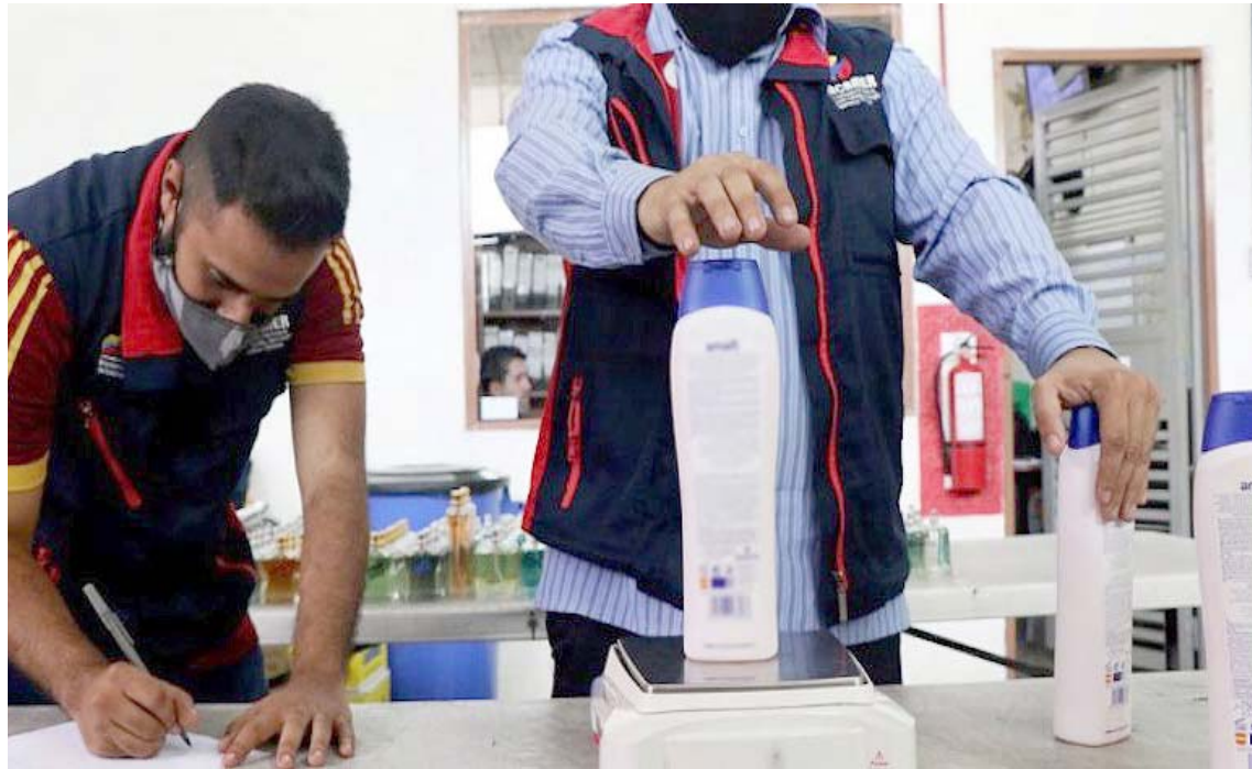
León resumió lo conseguido por la clase obrera este 2020.

Respecto a sus actividades operativas, el Sencamer ejecutó 7.126 fiscalizaciones en estable-