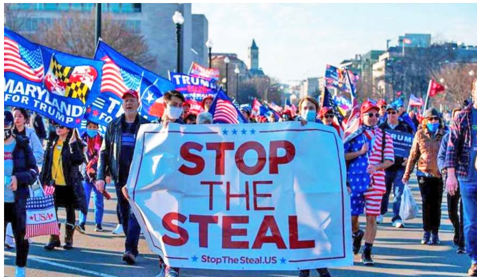
Los partidarios del magnate insisten en que hubo "un fraude electoral"

A causa de esta nueva convocatoria de Trump, difundida en su cuenta de Twitter, se espera que miles de simpatizantes