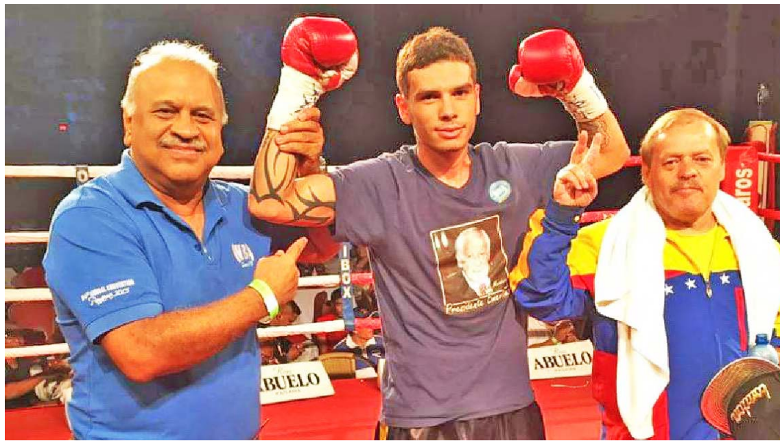
El zuliano tiene poder en sus puños